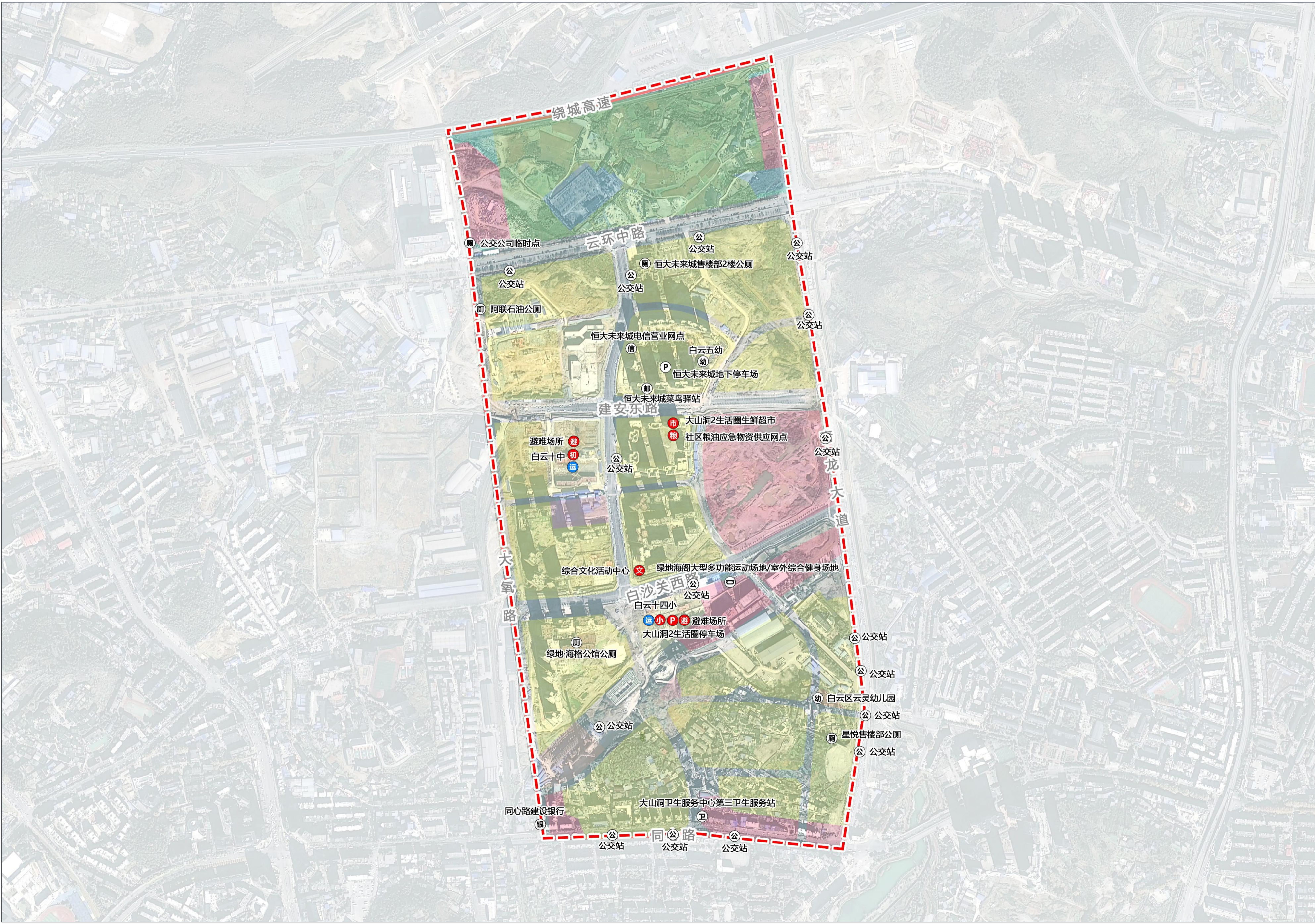
生活圈设施布局图