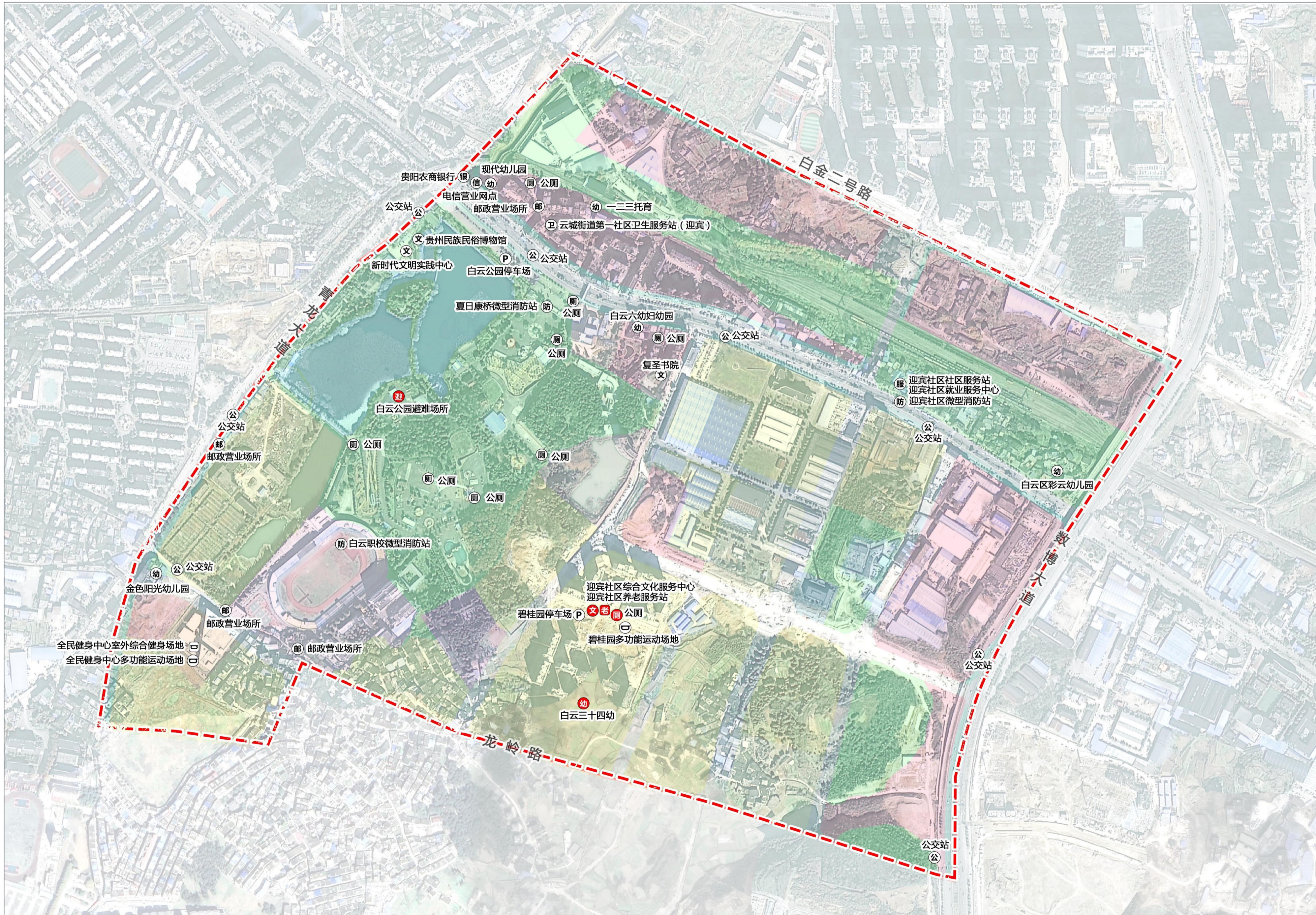
生活圈设施布局图